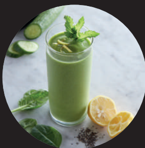
JUS ET SMOOTHIES