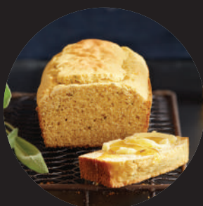
PAINS ET PÂTISSERIES