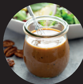
VINAIGRETTES ET MARINADES