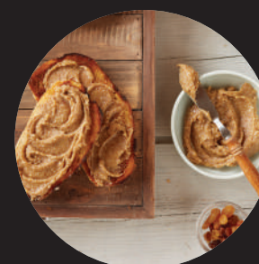
BEURRES ET PÂTES À TARTINER